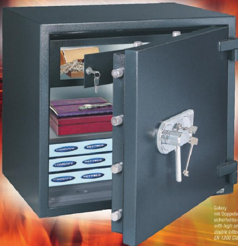
Galaxy mit Doppelbart-Hochsicherheitsschloss / with high security double bitted key lock EN 1300 Class A