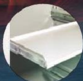
Teleskop-Fachboden Telescopic shelves to pull out