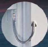
EMA-Vorbereitung EMA preparation