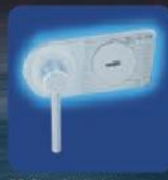
DB Standardlock Doppelbart-Hochsicherheitsschloss EN 1300 Klasse A. DB Standard Lock High security double bitted key lock EN 1300 Class A