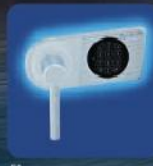
EL Elektronisches Sicherheitsschloss EN 1300 Klasse B (ohne Revision) inkl. 9 Volt Blockbatterie EL Electronic security lock with EN 1300 Class B (without revision) included 9 Volt blockbattery