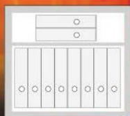
Galaxy.Fire 60 IT 10 Ordner / Folder

Die Ordner-Einteilungen ist ohne Innentresor. All divisions are without interior safes.